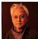
写真家 瀬戸正人氏