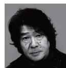
写真家 森山大道氏

企画・販売 プレクス株式会社 Plexus Co., Ltd. 設立：2010年11月 資本金：300万円 所在地：〒160-0004