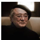
メディアアーティスト 飯村隆彦氏